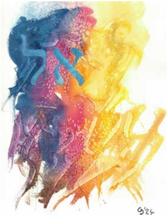
peinture : Claude Delabays