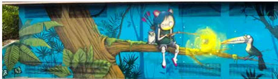
Amikal, partie d'un graffiti sur un abri des SIG

Envoie dès maintenant un courriel à christophe.riegen@protestant.ch ou appelle-le au 0033/6.71.66.52.75 pour en parler avec lui.