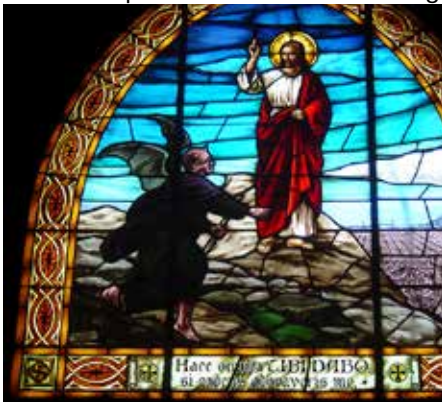
Jésus jeûne 40 jours puis est tenté Temple de Sagrat Cor à Barcelone

reste la source de la pratique spirituelle du jeûne, en amont de toute déformation ou manipulation. Car il reste sensé de ne pas laisser notre relation aux nourritures terrestres boucher les canaux subtils des nourritures célestes. Sans tomber dans les excès, dénoncés de bout en bout par la tradition de l'Eglise. Ainsi avec cette sentence des Pères du désert : « tu te vantes de t'abstenir de viande... mais tu dévores la chair de tes frères, par ton comportement ! ». ☩