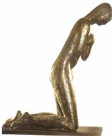
La prière, Constantin Brancusi, 1907