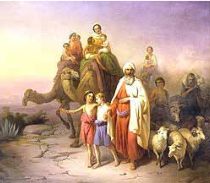
Le voyage d'Abraham, Jozsef Molnar, 1850