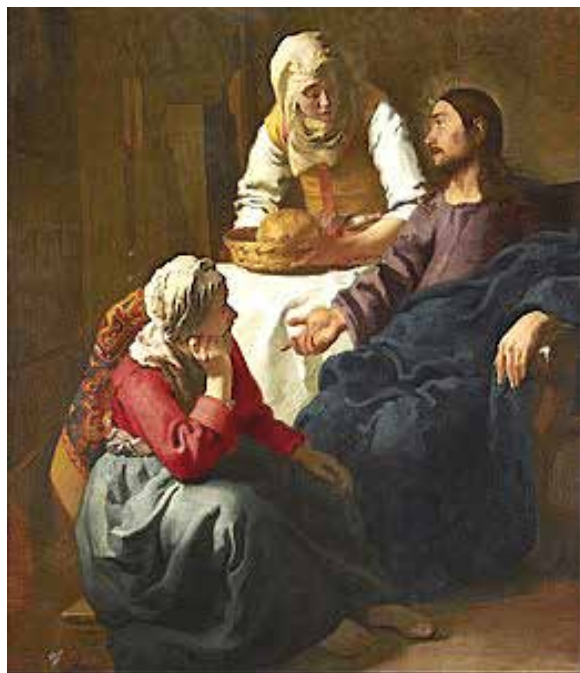
Le Christ dans la maison de Marthe et Marie, Jan Vermeer van Delft, vers 1655