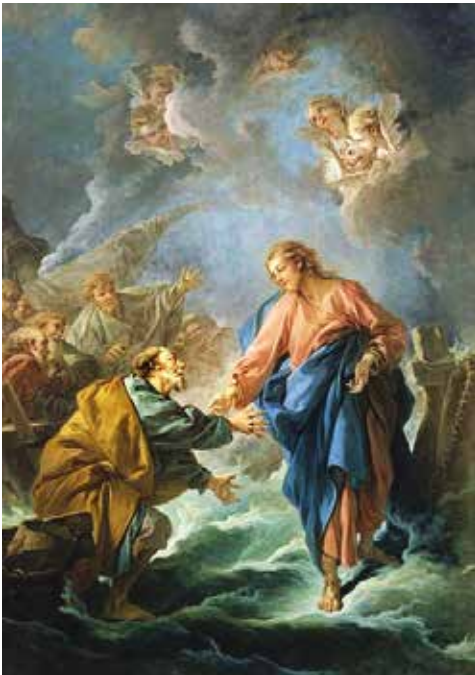
Saint Pierre tentant de marcher sur les eaux, F. Boucher, 1766

Me reste de cette époque un verset du psaume 23 totalement sorti de son contexte "je n'ai pas peur parce que tu es avec moi" que je me répétais comme un mantra à chaque difficulté ou chagrin, le "tu" s'adressant au magicien qui fera disparaître les obstacles et me rassurerait. On n'est pas encore dans la confiance, même avec ce beau verset. Cette confiance a mis du temps pour arriver dans ma vie, C'est dans un groupe d'amis où on partageait beaucoup que j'ai appris à m'ouvrir aux autres et à recevoir leur parole. J'ai enfin appris à avoir confiance en l'autre, en les autres. Il me semble que c'est à ce moment aussi que, renouant avec une vie spirituelle, j'ai reçu, oui, on peut dire reçu, cette conviction qu'il y a "un-e autre, plus grand/e que moi" qui s'est glissé dans mon quotidien. Pour moi, la confiance en Dieu passe par mon prochain, impossible de les dissocier. Après un récent bouleversement dans ma vie, cette colonne vertébrale qui me tient vacille, un doute profond s'installe parfois, mais le verset du psaume 23 m'accompagne toujours. ≡