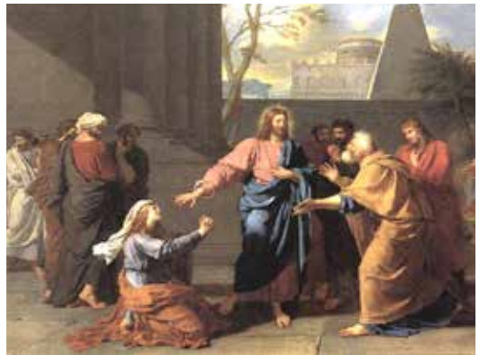
La Cananéenne aux pieds du Christ, J.-G. Drouais, 1784