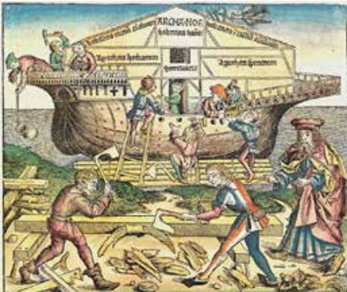
Noé dans la chronique de Nuremberg , 1493