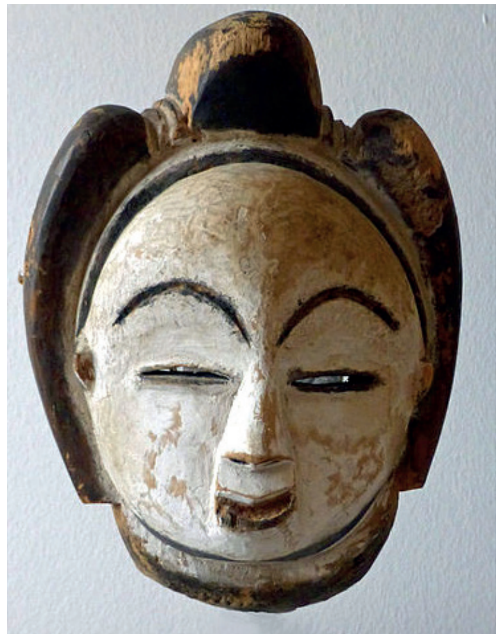
Masque Punu, Gabon