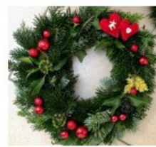
Prix : 30 ou 40 Frs selon grandeur et décorations