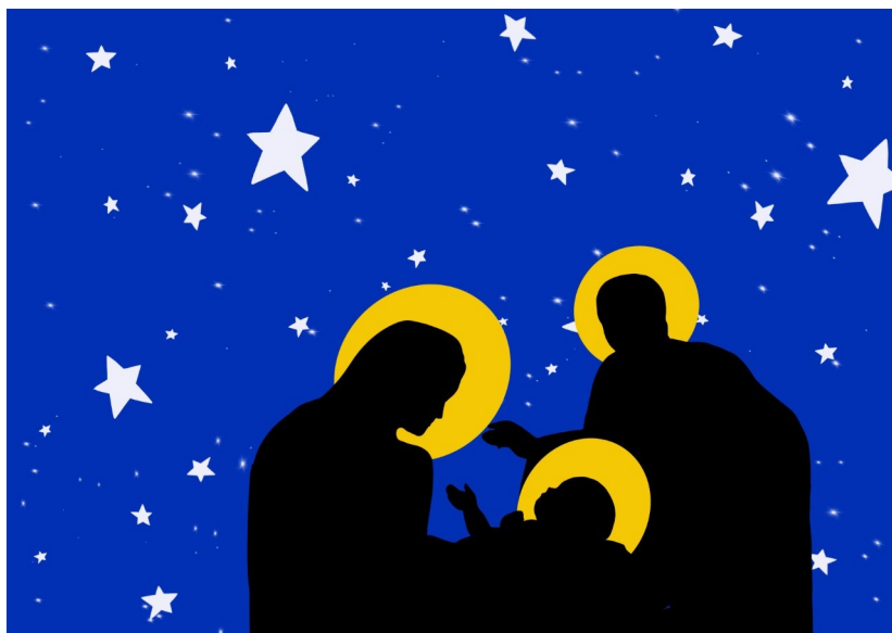
Dessin : Mailys Gribi

Espoir, Etienne, Georgette, Ghébré, Philippe