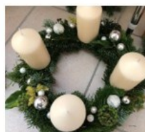
Prix : 35 ou 45 Frs selon grandeur et décorations