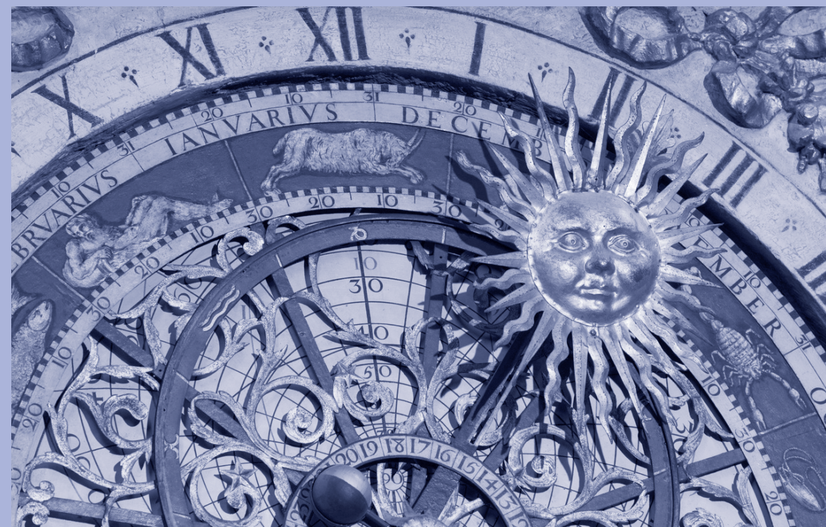
Horloge astronomique de la Cathédrale Saint Jean Baptiste à Lyon de 1379, réparée en 1598, complétée à son état actuel en 1660.

Région Jura-Lac Versoix | Genthod | Bellevue | Collex-Bossy Pregny-Chambésy | Grand-Saconnex | Petit-Saconnex