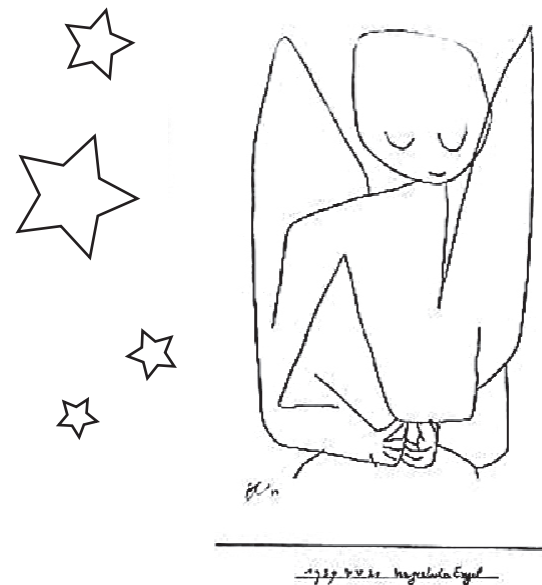
Paul Klee : L'ange oublieux (1939)

Paroisse des 5 communes Genthod | Bellevue | Collex-Bossy Pregny-Chambésy | Grand-Saconnex