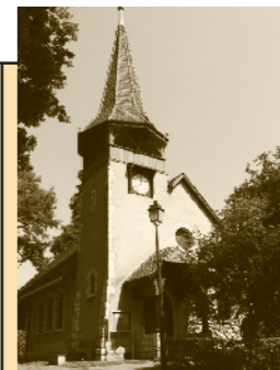
Chapelle des Crêts au Grand-Saconnex Ch. des Crêts-de-Pregny 11