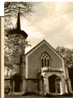
Temple de Versoix Route de Sauvigny 9