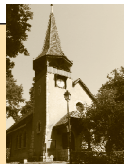
Chapelle des Crêts au Grand-Saconnex Ch. des Crêts-de-Pregny 11