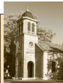
Temple du Petit-Saconnex Place du Pt-Saconnex 1