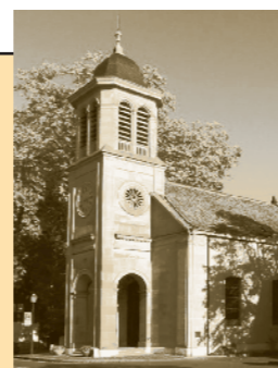
Temple du Petit-Saconnex Place du Pt-Saconnex 1