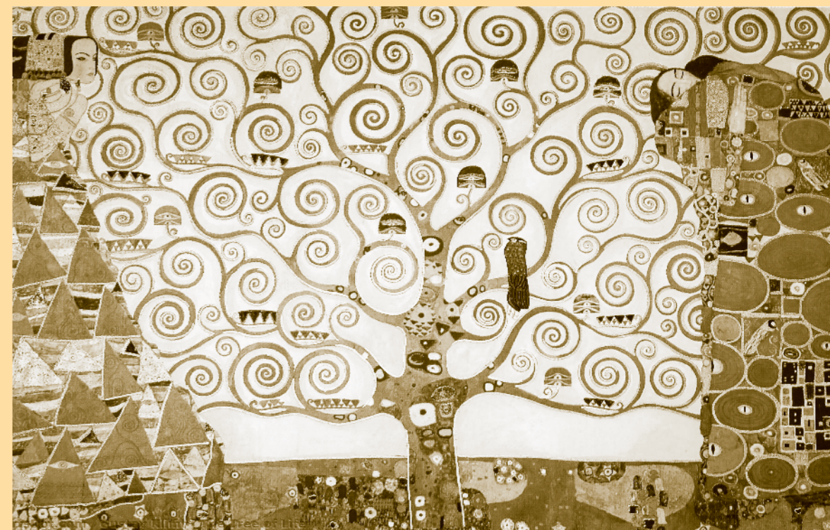
Gustav Klimt (1862-1918), L'Arbre de Vie (1905-1909), assemblage des 3 cartons pour la fresque du palais Stoclet, musée des arts appliqués, Vienne.

Région Jura-Lac Versoix | Genthod | Bellevue | Collex-Bossy Pregny-Chambésy | Grand-Saconnex | Petit-Saconnex