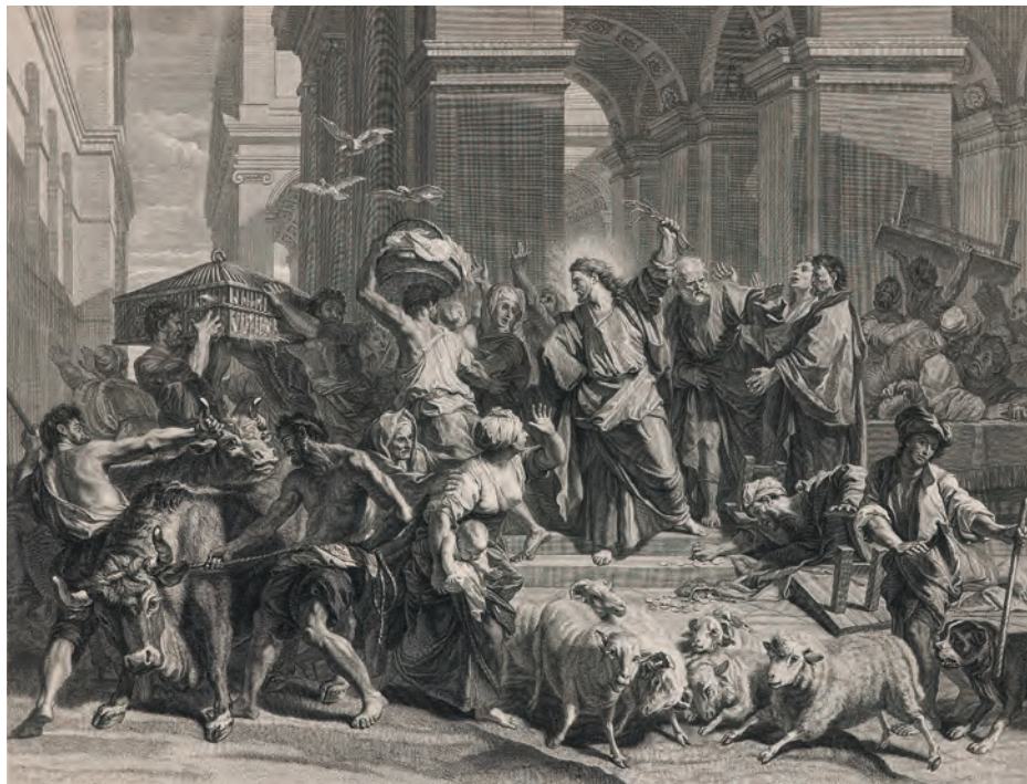
Le Christ chassant les marchands du temple - MAH Musée d'art et d'histoire, Ville de Genève. Ancien fonds