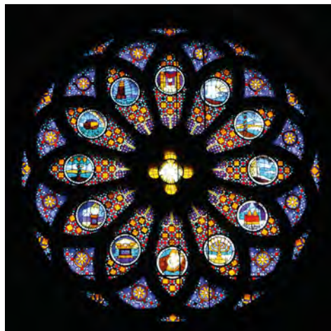
Hors concours, une des rosaces de la cathédrale St-Pierre, avec des motifs du Premier Testament. L'autre rosace représente des récits du Nouveau Testament.

Les couleurs des vitraux ont également une signification : le rouge symbolise la passion du Christ, le bleu la divinité, et le vert la vie éternelle. La lumière qui traverse le verre coloré est perçue comme une métaphore de la présence de Dieu, apportant une dimension mystique et transcendante au lieu de culte. En cela, les vitraux renforcent l'expérience spirituelle et la connexion à l'au-delà.